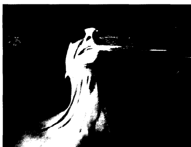
Η τρομερή καταγίδα άνθρωπος