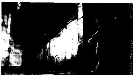
Ένα δέντρο μια φορά

Ένα από τα πιο ανατρεπτικά καρτούν στο πρόγραμμα του φεστιβάλ είναι το « Ζήτω η Κρίση! », του Ρουμάνου Αλέξει Γκουμπένκο. Σε μόλις 3' προφταίνει να επιχειρηματολογήσει... υπέρ της οικονομικής κρίσης με αφοπλιστικό τρόπο! «Η κρίση είναι σαν φρέσκο αεράκι στη φύση», υποστηρίζει ο Γκουμπένκο. «Ένα καταναλωτικό διάλειμμα που επιτρέπει στα δέντρα να αναπνεύσουν, συντελεί στη μείωση της ρύπανσης και μοιάζει με νίκη του ποδηλάτου στον κινητήρα της μηχανής»!